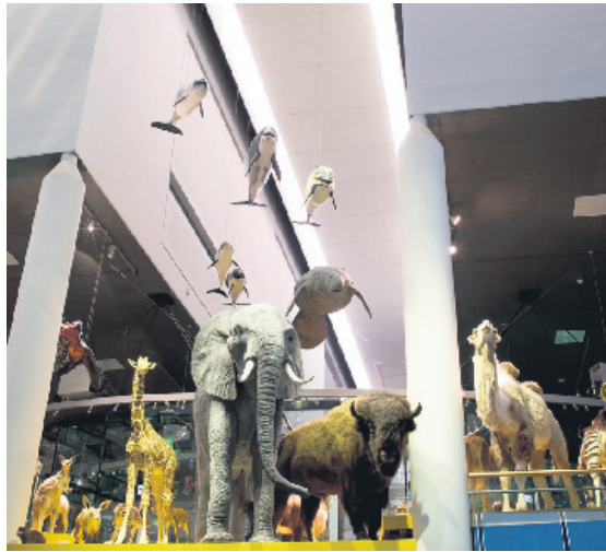
Door de verschillende soorten blijft de natuur in evenwicht.

De Coalitie Biodiversiteit zet zich samen met haar ruim 200 partners in om mensen te laten zien hoe belang-